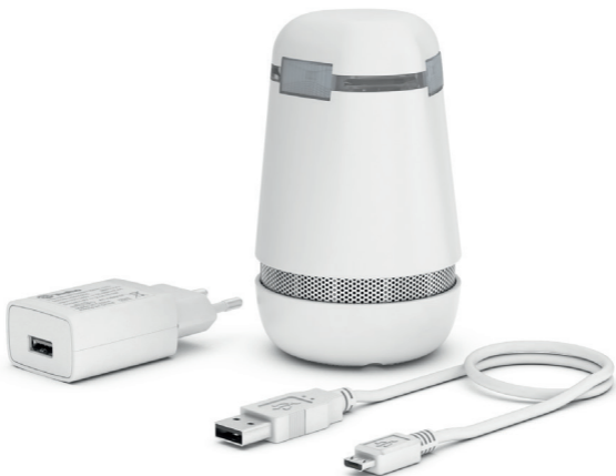
Illustration avec un boîtier blanc, spexor est également disponible dans d'autres couleurs.